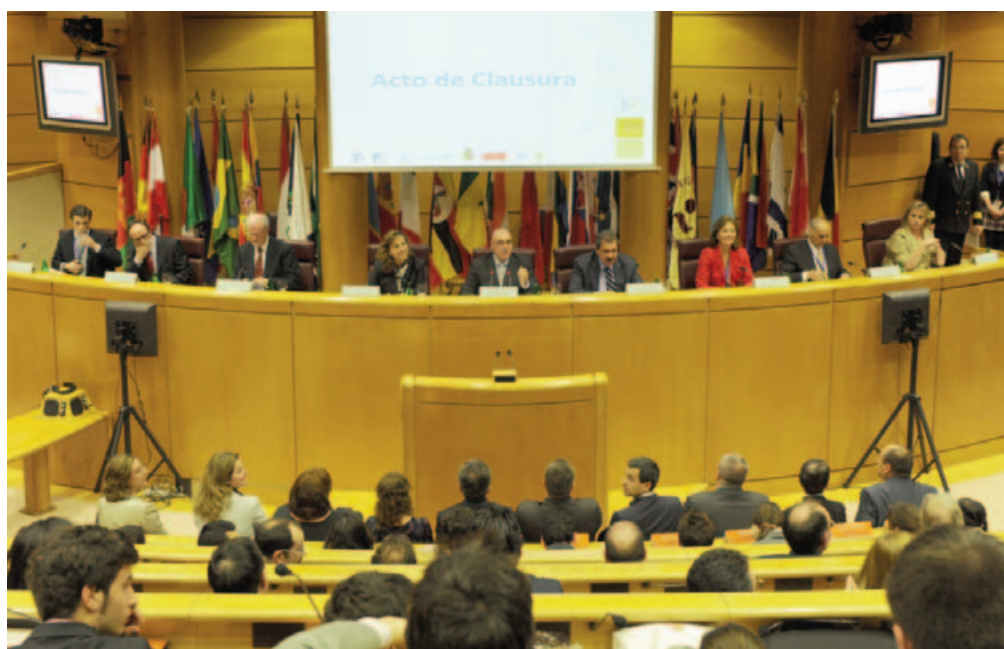
IV Encuentro SEKMUN. Acto de clausura.

En el encabezado deberá figurar, por este orden, el órgano correspondiente, el tema y los avales.